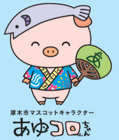
厚木市マスコットキャラクター あゆのり