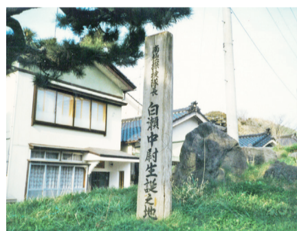
戦中は白瀬中尉生誕の地に疎開していた

戦況が激化すると、笠間町にも空襲の危険が迫り、日本海に面した秋田県金浦町の浄土真宗・浄蓮寺に再疎開。この寺は日本で最初に南極探検を敢行した白瀬中尉の生家だ。疎開生活では、勉強より労働に多くの時間を費やした。塩づくりの塩田作業もその一つ。バケツに汲んだ海水を砂の田一面にまくきつい仕事。午前2回、午後3回。そのたび、満足に食べていない腰がふらつく。だが、水泳の楽しさを知ったのも金浦の澄んだ海だった。