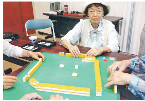
マーじゃんは新しい仲間づくり

私は50代のとき、カラオケに興味を持ち「声がきれい」と友だちに誘われて、奉野のカラオケ教室に半年ほど通いました。横浜でカラオケ指導員の大会が開かれ出場しました。お蔭様で全国カラオケ指導員教授の免状を得ることができました。そのときの感動と感謝は今でも忘れません。60代になってもカラオケは歌っていました。70代になり、認知症予防にマーじゃんが最適と聞き、長寿会の初心者マーじゃん教室に入りました。だがテキストを見て難しい、それに体調もくずし、お休みが続きました。これでは認知症になっちゃうと思いい、今年4月から毎月3回、午前中の2時間ぐらい、6人ほどの仲間に加わりました。顔を突き合わせる楽しさを覚えまし