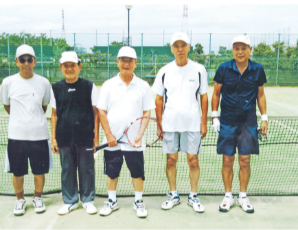
テニスの仲間たち

戸田にある厚木国際テニスクラブは、歩いて10分の距離にある。習い事として半年間、スクール通いをした。暮れも押し迫る30日、障子の張り替えを家内に任せて、朝から夕刻までプレイしたことを今では後ろめたい気持ちでいる。土曜日と日曜日は欠かさず通った。社内での人間関係から始めたゴルフがきっかけで、テニス仲間とは疎遠となり、やがて、年金生活者となり落ち着きを取り戻しつつあったさなか、疎遠にしていた仲間一人から声がかかり、再開することとなった。メンバーに旧知の者はいなく若かったが、すぐに友だちになれた。残念で仕方ないが、その声をかけてくれた友が心筋梗塞でコート内で倒れた。連携プレイよろしく、一命を取り留めた。