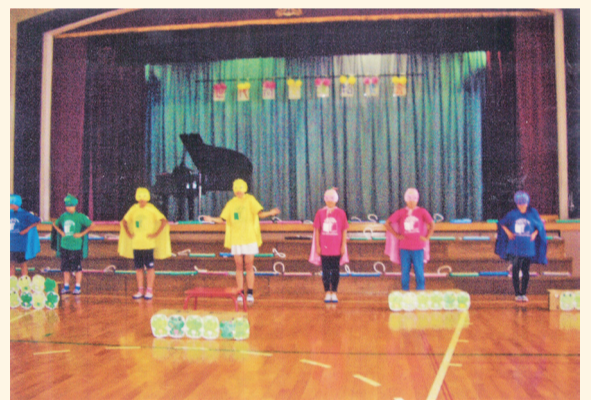
レンジャーズ登場