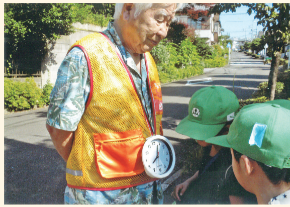
子どもたちに大好評の「動く時計台」

森の里小の通学路に立つ学童見守り隊の胸にぶら下げた直径25cmの丸時計。子どもたちが喜んでると学校だよりに載りました。