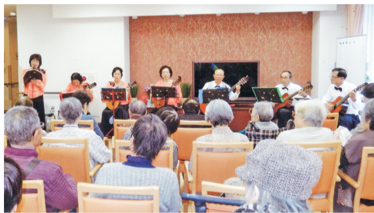
仲間と一緒にだから続けてこられたギターを発表

声出しの経験は、八王子で学生時代に「謡曲手習い」、厚木に來てから「民謡の会」、そして定年前に始めた「歌謡教室(宮川たかし先生)」等々で、それが趣味となり、今では健康寿命の持続に役立っている。