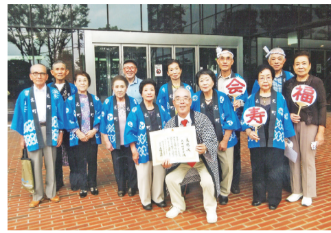
歌謡サークルの面々

5年前に元町福寿会(会員60人)の会長に就任したときに、「習い事」を始めて皆に楽しんでもらうことを考えた。すると、歌謡サークルがすでにあり、水曜日に元町公民館に女性6人が集い、歌を楽しんでいることが分かった。さっそく男性6人を招集して、同好人数が増えた。男性から新曲も覚えたいとの意見が出て、業者に手配して、曲幅も広まった。