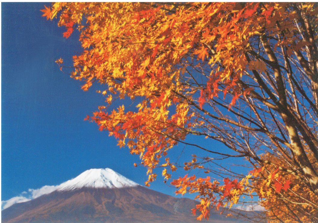
秋冷えの富士山