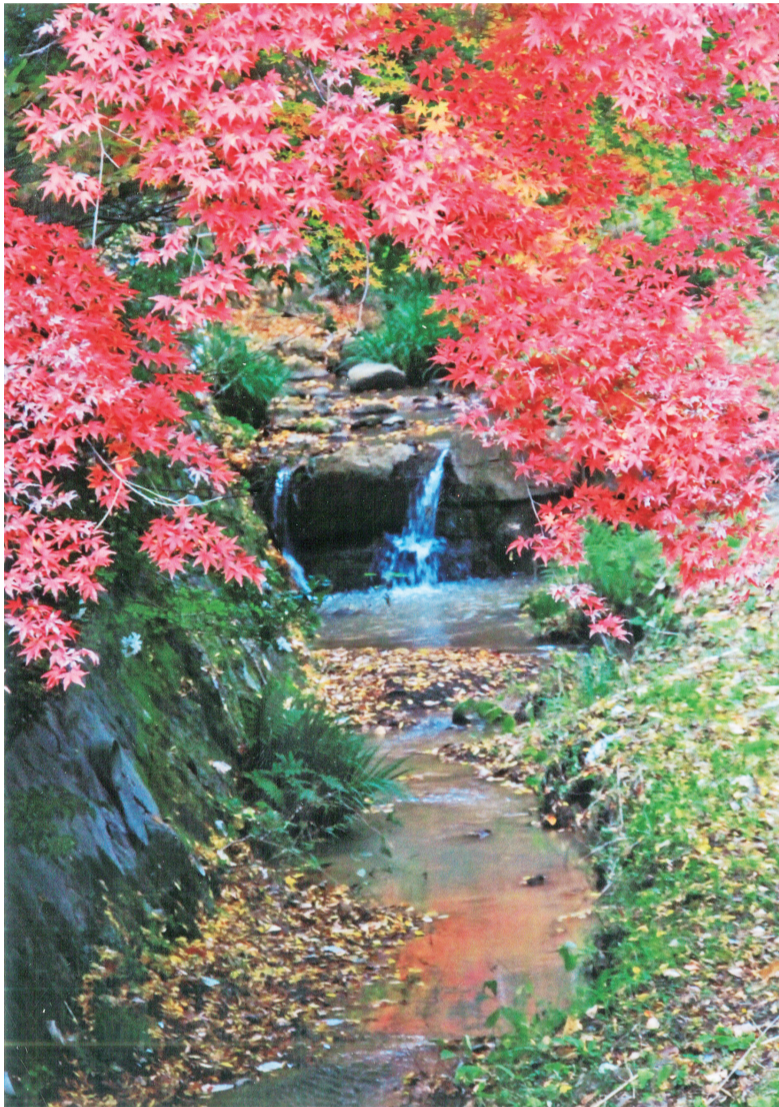
映える紅葉—厚木西高わき榎田川で

編集 広報委員会 制作・印刷 株式会社ニチコミ ☎03-5718-3900 http://www.nichicomi.com/